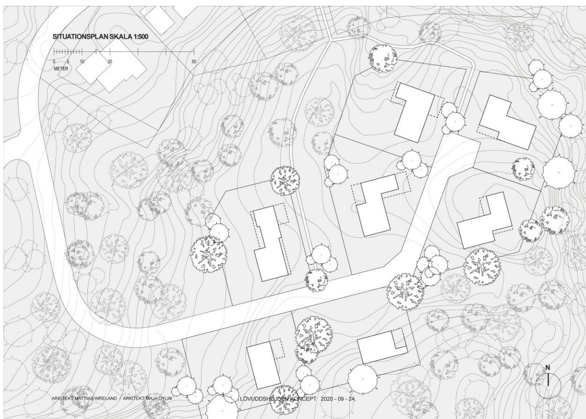
Illustration av planerad byggnation på de nya tomterna